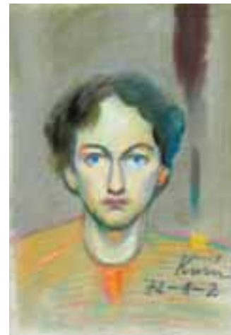
Önarckép. 1972 Pasztell, papír, 21 × 30 cm, j. j. l. Kovásznai 72-1-2