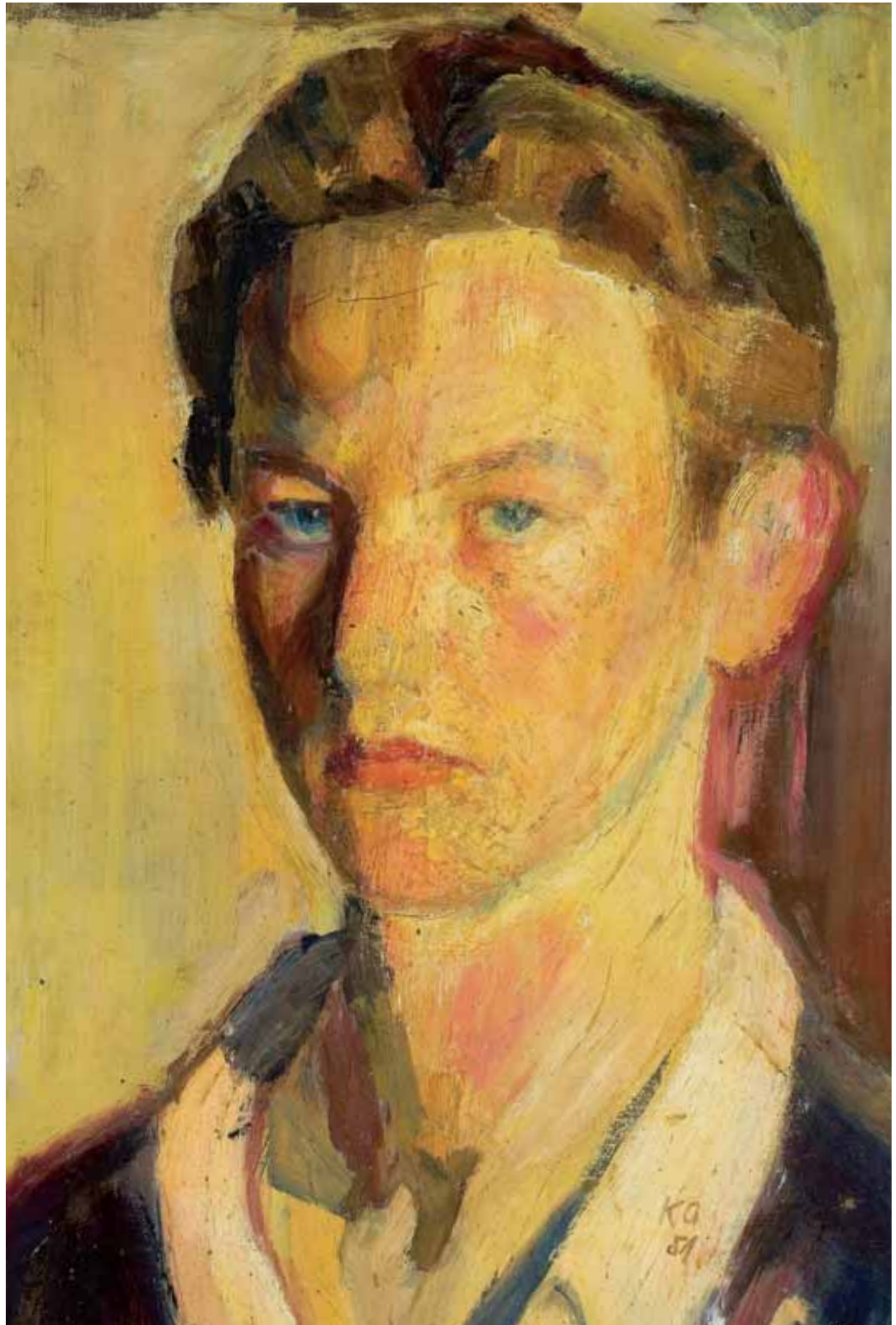
Önarckép 17 évesen. 1951 Olaj, vászon, 44 × 31 cm, j. j. I. KG 51