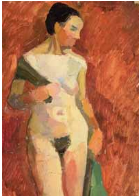
Akt-tanulmány. 1956 Olaj, kartonpapír, 35 × 25 cm, j. n.