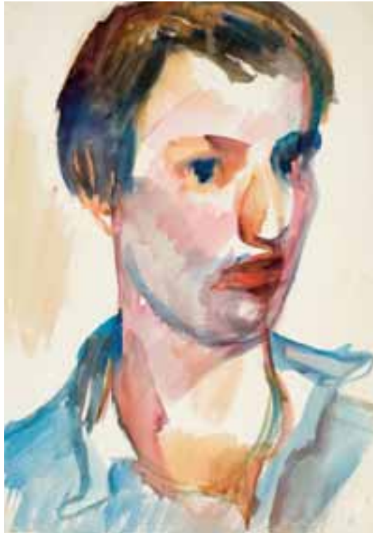
Őnarckép. 1957 körül Akvarell, papír, 43 × 31 cm, j. n.