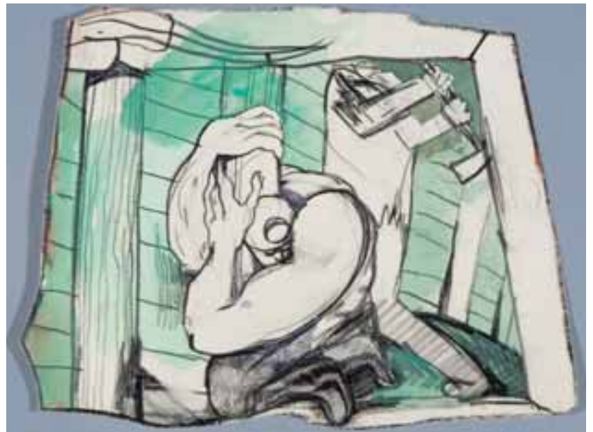
Bányász. 1955–1965. (Szerepel A Fény öröme című, 1965-ben készített filmjében.) Vegyes technika, papír, szabálytalan trapézforma, kb. 18 × 23 cm, j. n.