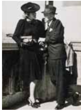
Édesanyja és nevelőapja esküvője. Budapest, 1939. szeptember 23.