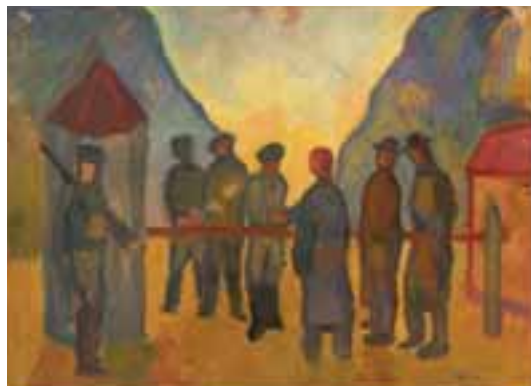
Határon. 1951 körül Akvarell, papír, 28 × 38 cm, j. n.