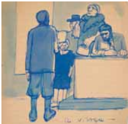
A vizsga. 1950 körül Akvarell, papír, 19,5 × 20 cm, ft. j. I. A vizsga