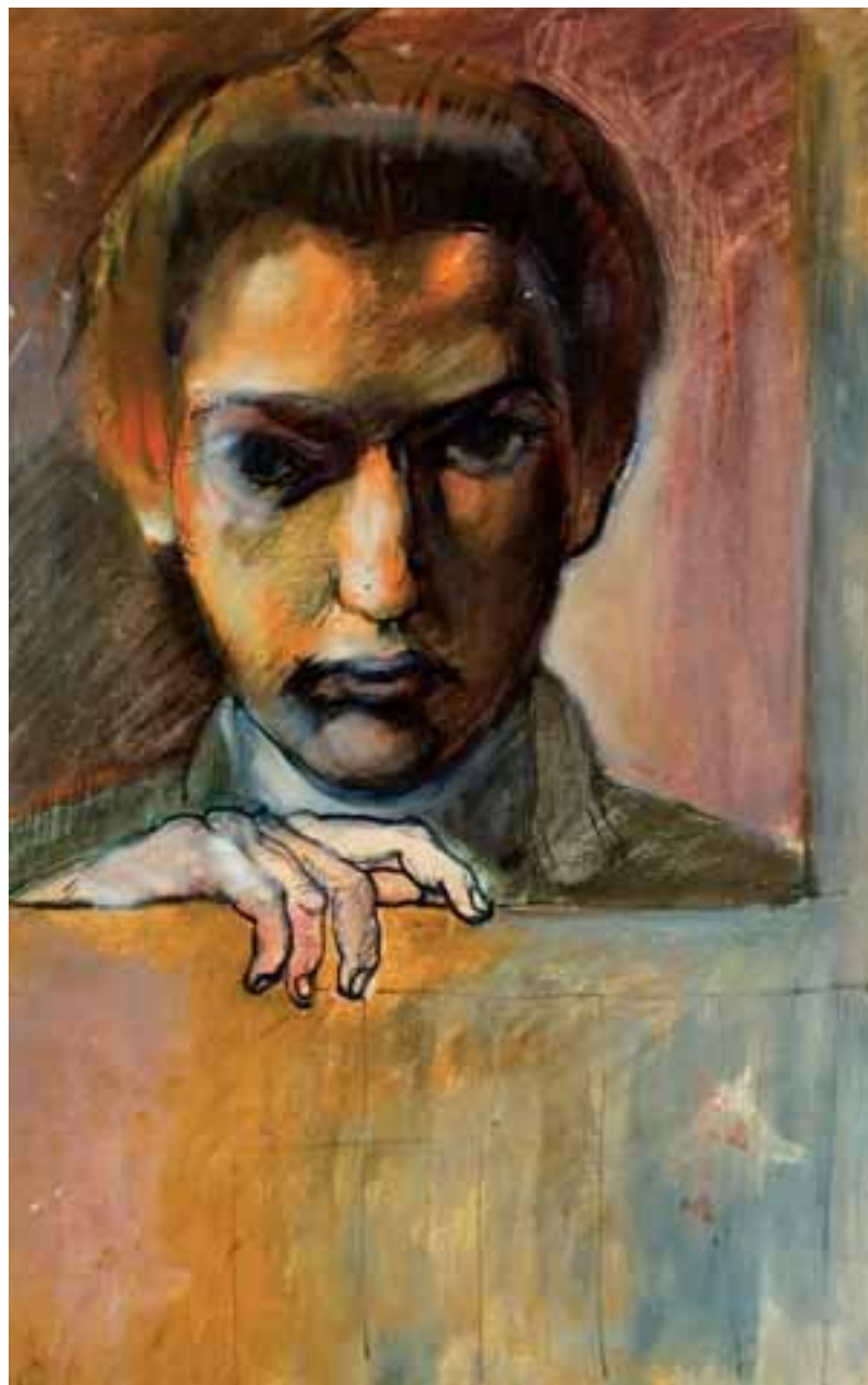
Önarckép. 1956 körül Vegyes technika, papír, 38 x 25 cm, j. n.