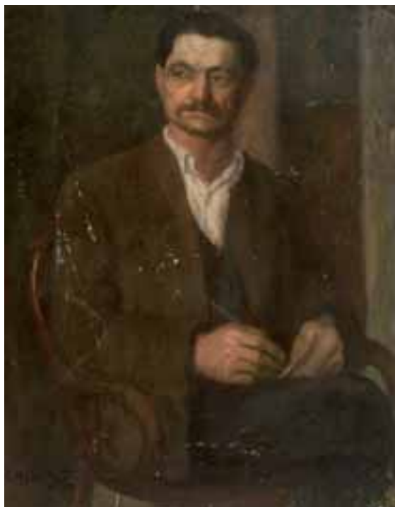
Bajuszos férfi. 1952 Olaj, vászon, 73,6 × 57 cm, j. b. I. KOVÁSZ