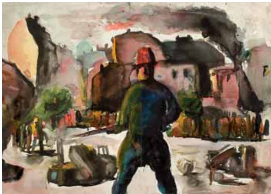
Katona. 1951 körül Akvarell, tus, papír, 40 × 55 cm, j. n.

„A mai magyar művészet előre mutogat és hátrafelé biceg.”