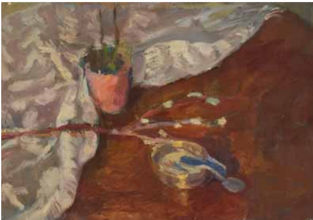
Csendélet. 1952 körül Olaj, papír, 30 × 50 cm

világított, megértetvén, hogy ez az átok-manír mélységesen művészetidegen valami, és hogy a művészet természetes közege – hisz épp ezért lett kitalálva – a derű, a nyájasság, a napfény, a boldogság, a kellem, tehát a charme, mellyel akkor ő megajándékozott minket, az ő jámbor és szájtató lelki szegényeit. Rányította szemünket Rippl szívet melengetően intimus pasztelljeire, hogy szép hagyományaink közül a szelíd, toleráns, nyájas, jóízű, emberséges vonásokat emelje ki. És mindezt ezerkilencszáznegyvenkilenc telén, te úristen! 4