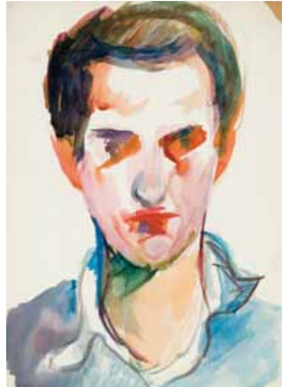
Őnarckép. 1957 körül Akvarell, papír, 43 × 31 cm, j. n.