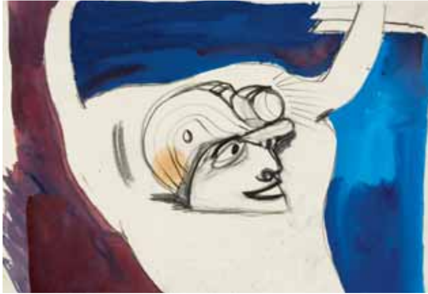
Bányász. 1955–1965. (Szerepel A Fény öröme című, 1965-ben készített filmjében.) Vegyes technika, papír, 22 × 31 cm, j. n.