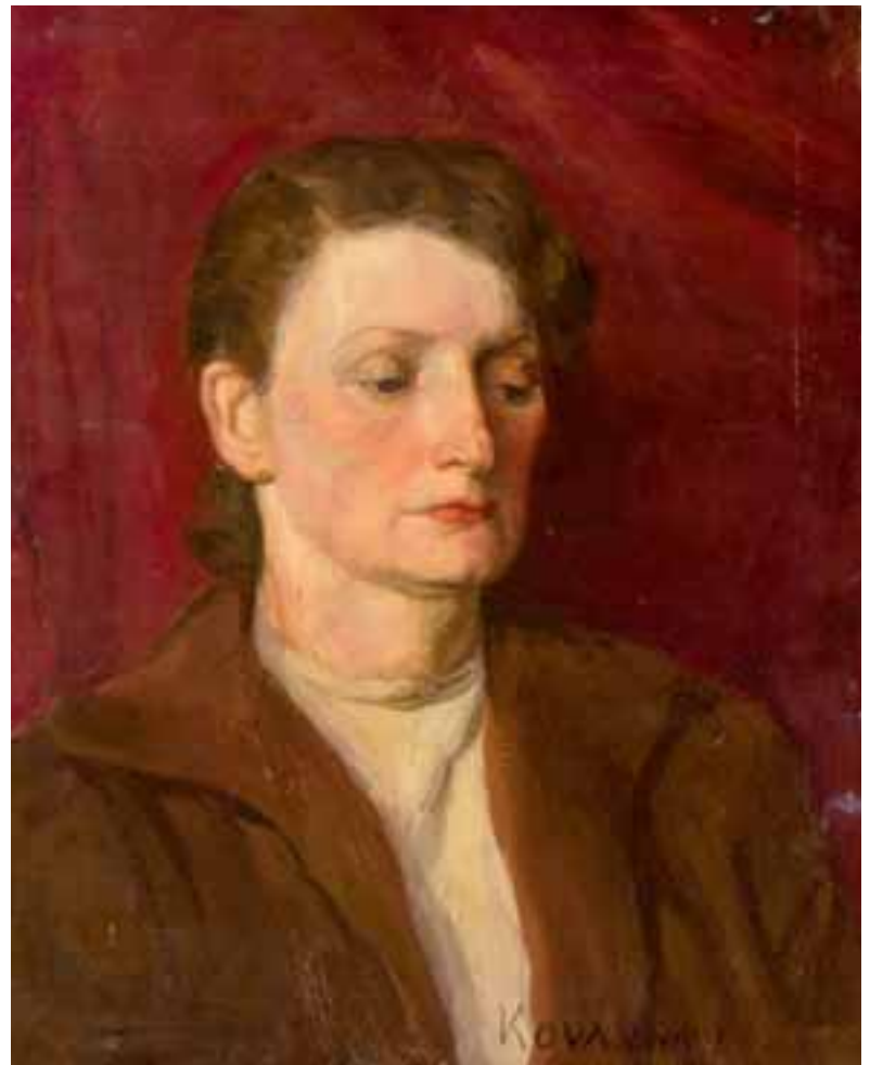
Nő vörös háttér előtt. 1952 Olaj, vászon, 50 × 40 cm, j. i. Kovásznai