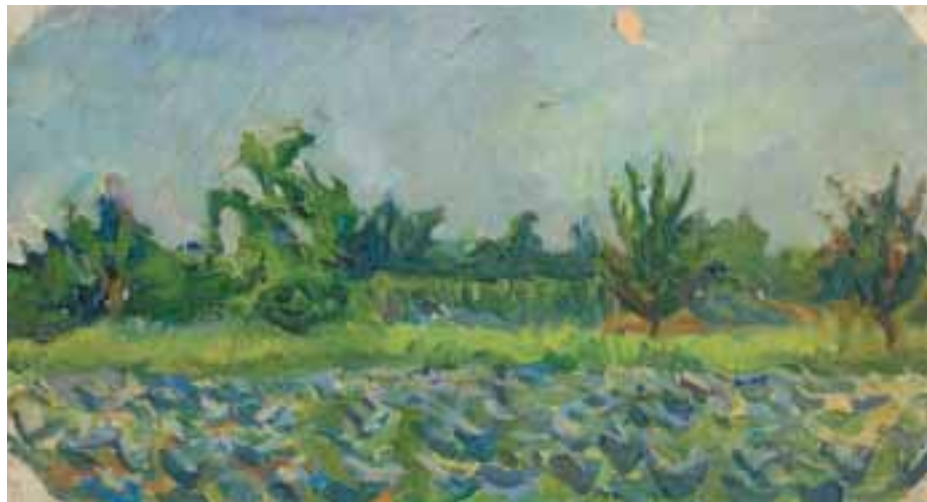
Káposztaföld fákkal. Tanulmány. 1953 körül Olaj, vászon, 19 × 35 cm, j. n.

„moderneskedő” tanítványai melletti feltétlen kiállítás jellemezte. 20 Bernáth jelentette a húszéves művész számára azt az idealizált kapcsot a képzőművészeti élet lehetséges megértő, puhább közegével, amely a festőművész pálya folytatásának egyetlen elfogadható alternatívájának tűnt akkoriban. Komlón, 1954 októberében kelt levelében így ír Bernáthnak: