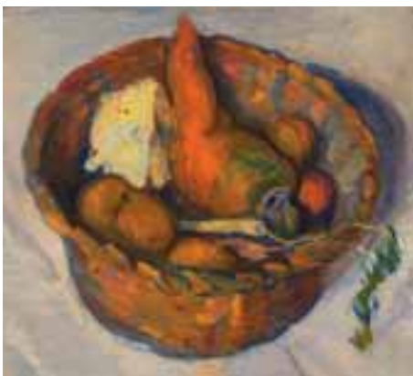
Csendélet. 1952 körül Olaj, farost, 30 × 30 cm