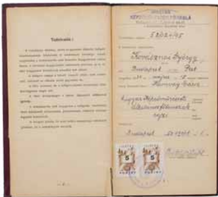
Főiskolai leckekönyv Budapest, 1952. szeptember 1.