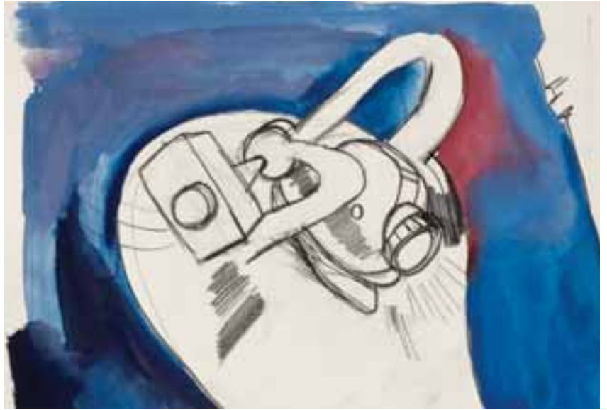
Bányász. 1955–1965. (Szerepel A Fény öröme című, 1965-ben készített filmjében.) Vegyes technika, papír, 22 × 31 cm, j. n.