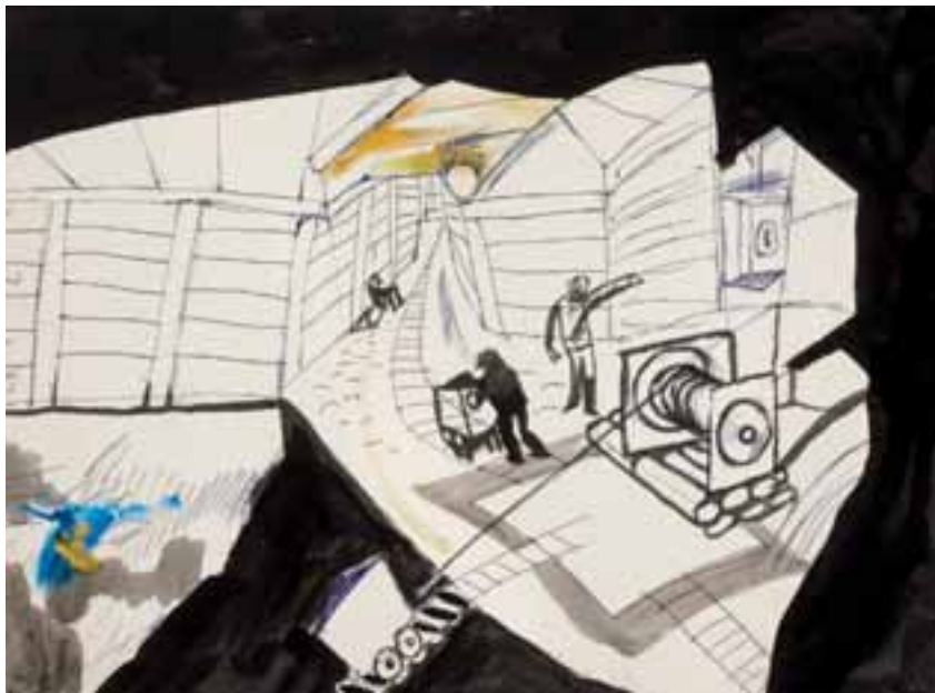
Tárnában dolgozó bányász. 1955–1965. (Szerepel A Fény öröme című, 1965-ben készített filmjében.) Vegyes technika, papír, 31 × 42 cm, j. n.