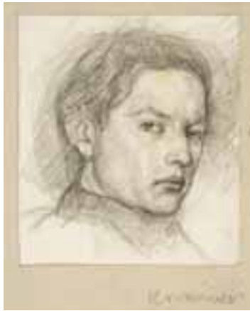
Önarckép. 1950 körül Grafit, papír, 25 × 22 cm, j. j. I. Kovásznai